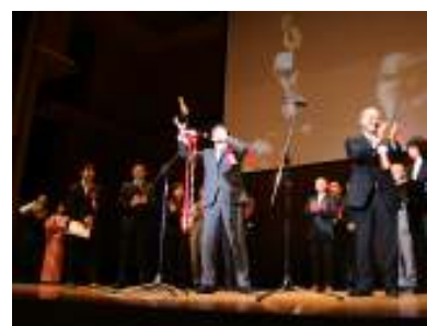
表彰式の様子 ※全て第三回の模様