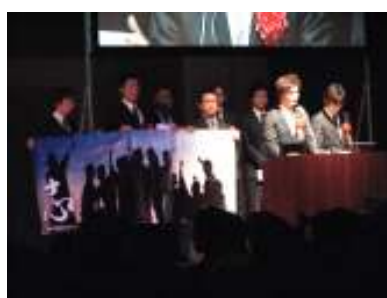
最終審査のプレゼンテーション