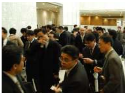
来場者の様子(受付にて)