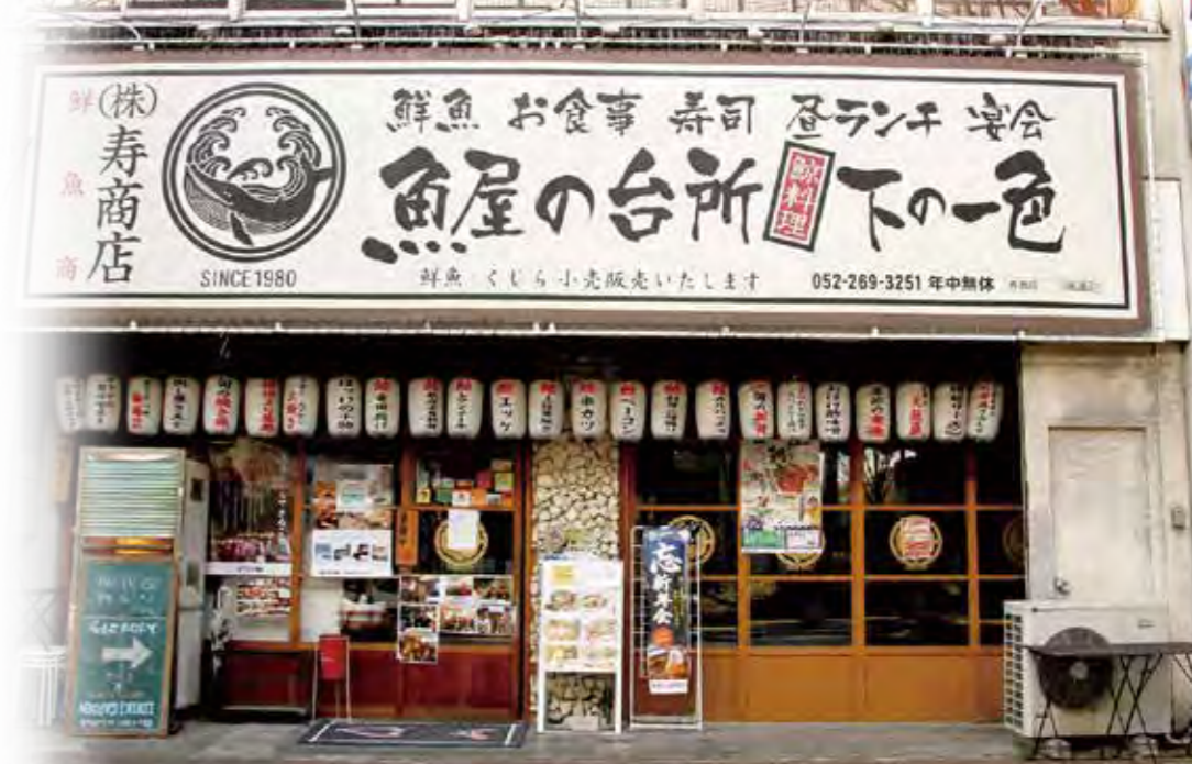
下の一色 本店兼本社