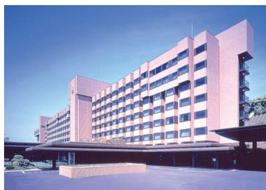
1963年に開業した城山観光ホテル。2011年3月の九州新幹線全線開通を控え、サービス向上にも力が入る。

例えば、「従業員同士の挨拶なくしてお客様への自然な接客・挨拶はできない」をキャッチフレーズとして掲げる「挨拶キャンペーン」。自分のテリトリーのお客様には積極的