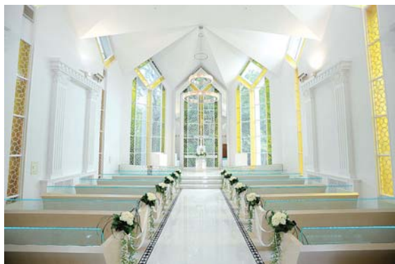
城山観光ホテルの創業と共に半世紀の歴史を持つウェディング。出産や子供の入学、金婚式など、ウェディングから始まる人生の様々なシーンに対応できることが強みだ。