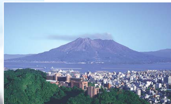
ホテル最上階に位置するスカイラウンジレストランからは、洗練されたサービスと共に四季折々の鹿児島の風景が楽しめる。ほぼ全てのお客様が目的を持って来店されることを意識し、「究極のおせっかい」をテーマにサービス向上に取り組む。

る事こそが、ブライダルに携わる者にとって必要であると思っていま す。MSRはそのための貴重なツ ールとして捉えています。